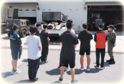
2年生ジュニアインターンシップ